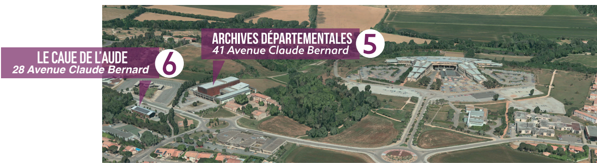
LE CAUE DE L'AUDE 28 Avenue Claude Bernard 6